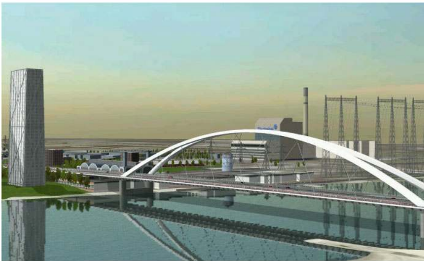
Royal Haskoning: de nieuwe Waalbrug voor Nijmegen moet in 2013 gereed zijn.

» ontwikkelingen en andere zaken die voor advies- en ingenieursbedrijven interessant zijn.