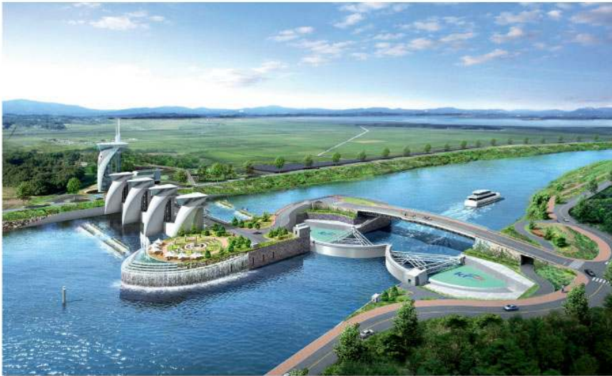
Arcadis ontwierp voor Zuid-Korea een kleine uitvoering van de Maeslantkering bij Hoek van Holland: een stormkering in de Yeongsan River.